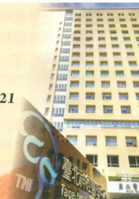
臺北神經醫學中心