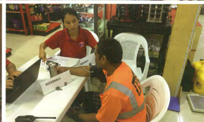
馬紹爾衛生中心轉診服務