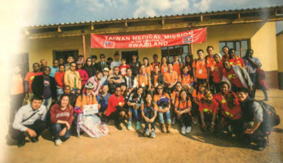
駐史瓦帝尼醫療團