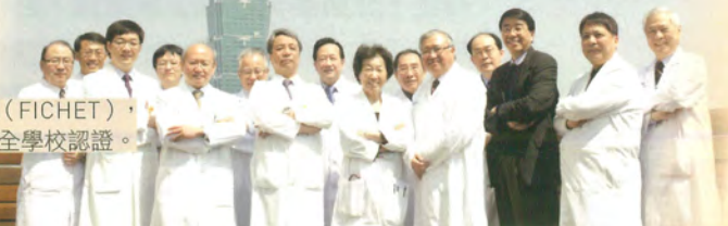
癌症轉譯研究中心學術研究團隊

通過大專校院國際化訪視 (FICHET)，並再次通過 WHO 國際安全學校認證。