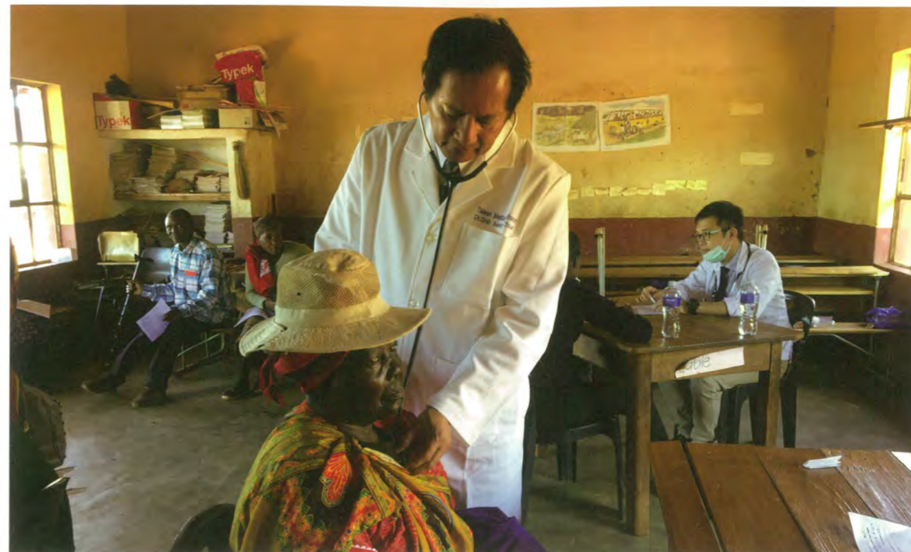
駐史瓦帝尼醫療團義診

除了對友邦提供醫療服務，一校三院也提供國際醫療培訓，接受友邦國家派員來臺學習臨床訓練、各項醫療照顧及國際醫務管理，從根源提升友邦國家的醫療人力資源素質及照護品質，近年計已訓練 40 餘國、數百名各國醫事專業人員。北醫以具體行動，為臺灣善盡一份國際公民的社會責任。