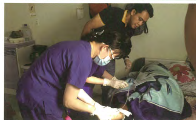
馬紹爾衛生中心義診