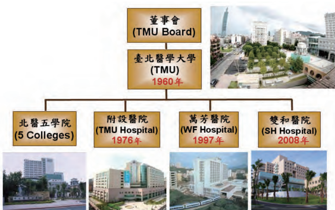
圖 3-2 臺北醫學大學與附屬醫院

本會董事長及董事均為無給職，董事會之職權、任期、選聘、改選、補選及董事會議等事項，均依照私立學校法及其施行細則有關之規定辦理，並明訂於本校董事會組織章程中。