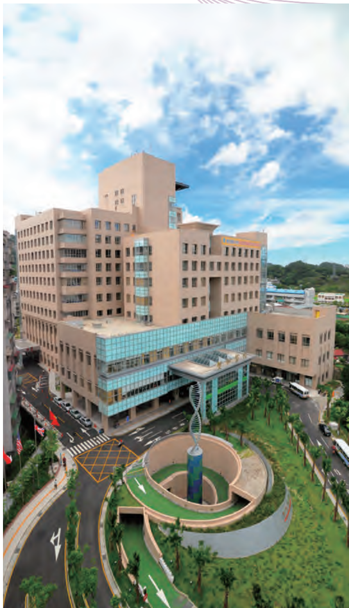
圖 3-1 雙和之美

雙和醫院是全國第一家 BOT【興建（Build）、營運（Operate）、移轉（Transfer）】，指政府將土地提供由民間興建、經營】的醫院，也是臺北醫學大學的第三家附屬醫院，預計於一、二期工程完工後總床數將達 1,580 床，不僅是北醫體系最大的醫院，同時與臺北醫學大學所屬的附設醫院、萬芳醫院形成大臺北的醫療金三角，總床數超過 3,000 床，與大學互為堅實的後盾。